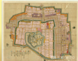
「姫路侍屋敷園」(1751(寛延4)~1754(宝暦4)年)