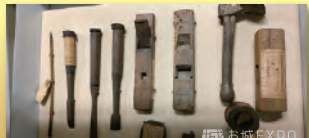
昭和の大修理時に発見された江戸時代の大工道具類

「姫路城と姫路城下町・姫路藩」をテーマに、下記の3つの視座から姫路城の部材などの貴重な実物資料などとあわせてご紹介する、ここだけの特別企画です。 1. 明治時代から現代にかけての保存修理の歴史と世界遺産登録について 2. 昭和の大修理の過程で交換された部材や絵画資料からたどる江戸時代の姫路城 3. 城下町としての姫路や、外港の飾磨津との関係、姫路藩内の生業についての展示